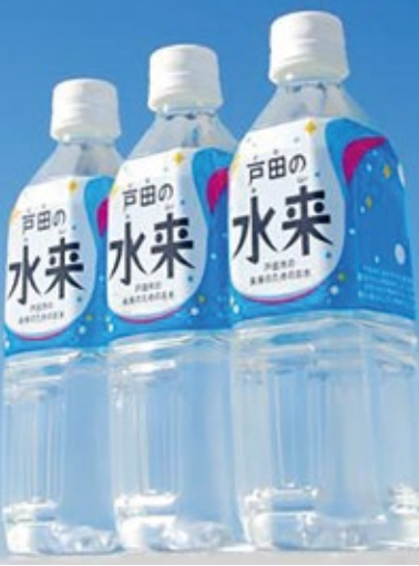
◀地下250メートルから地下水をくみ上げて作られる「戸田の水来」

議員 ①上下水道部門は、技術的継承と人材育成が課題。専門職としての採用を②水道管路の耐震化が進まない理由は③ディスプレイ設置後、維持管理に対する指導は④採算が取れていない戸田市の水「戸田の水来」の見直しを。