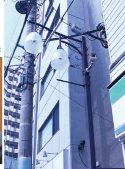
◀市内に設置されている街路灯

議員 環境問題や維持費の観点から、LED化促進のための改修工事やLED電気料への補助率の引き上げはできないか。